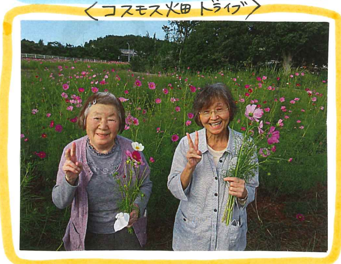
<コスモス火田ドライブ>