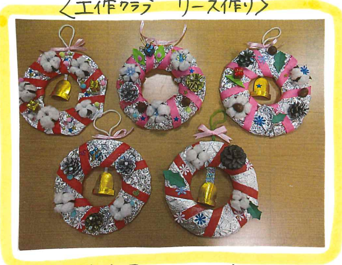
<工作クラブ リース作り>