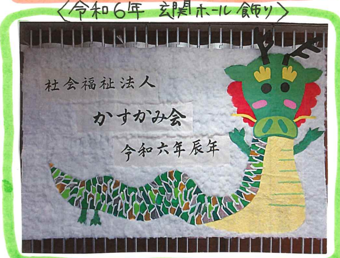
<令和6年 亥期ホニ飾り>