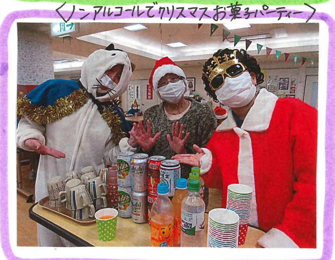
<ノンアルコールでクリスマスお菓子パーティー>