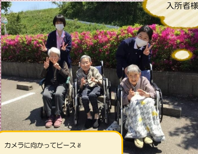
カメラに向かってピース👏 とってもきれいに撮れました📷 笑顔が素敵です👏

駐車場のつつじが満開だったので、天気の良い日に駐車場までお散歩にお出かけ♡ 最近はお外に出る機会があまりなかったためご入所者様も楽しんでおられました!!