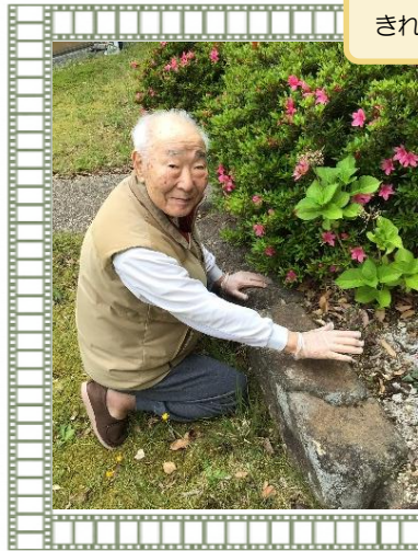
きれいに咲きますように🌸