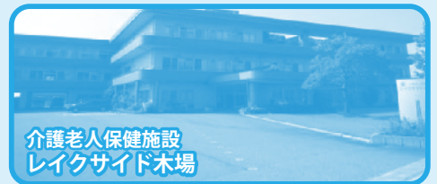
介護老人保健施設 レイクサイド木場