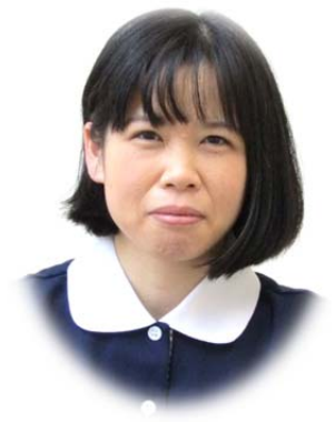
主任介護支援専門員