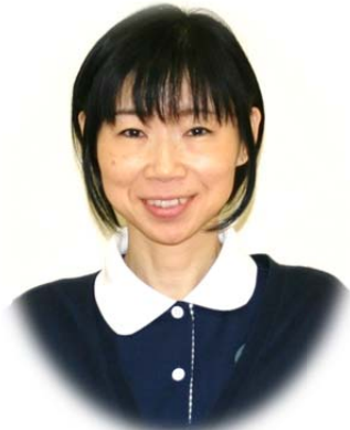
主任介護支援専門員